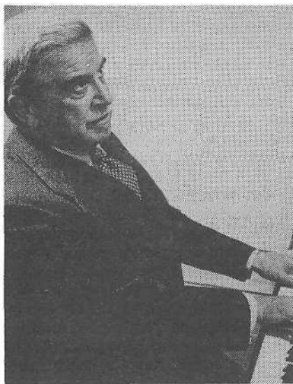
Artur Schnabel im Jahre 1948

In der Nachkriegszeit mehrten sich in den USA Aufführungen von Schnabel-Werken. Dimitri Mitropoulos setzte sich im Dezember 1946 in Minneapolis für die 1. Symphonie ein, 1947 erlebte New York die Uraufführung des 1945 entstandenen Klaviertrios und 1948 war in Cleveland unter der Leitung von George Szell die Uraufführung der Rhapsodie zu erleben. Aber erst Mitro-