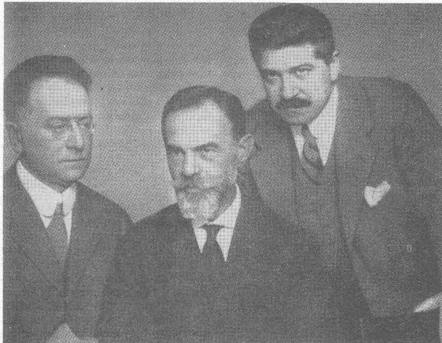
Artur Schnabel (r.) mit seinen Triopartnern Carl Flesch (l.) und Hugo Becker, 1915

Richard Dehmel gehörte um 1910 zu den meistgelesenen und auch meistvertonen deutschen Lyrikern; seine Gedichtbände «Zwei Menschen» und «Weib und Welt» waren in riesigen