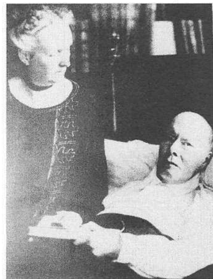
Winifred Wagner und Houston Stewart Chamberlain 1927, kurz vor dessen Tod

Welchen Wagner Hitler, dessen Wagner-Bild sich seit seiner Linzer Rienzi-Jugenderfahrung 1906 nicht mehr verändert hatte, meinte, lässt sich insbesondere einem Zitat aus dessen Gesprächen