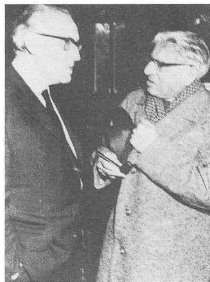
Wieland Wagner und Ernst Bloch 1966

bender Weise transparent. Ihm verdanke ich, Wagner in einem kulturell reichen und philosophisch-historischen Zusammenhang neu entdeckt zu haben. Unter seinem Einfluss emanzipierte ich mich nun auch äusserlich von dem Festspielhügel und meiner Bayreuther Kindheit. So verfasste ich meine Abiturarbeit in Deutsch über Arnold Zweigs «Sergeant Grischa» und später meine Doktorarbeit über «Weill und Brecht». Bloch, dessen Verfremdungsbegriff ich als Zentrum meiner «Weill-Brecht»-Studie nahm, verstand als Einziger sofort die Absicht meiner scheinbar rein «antiwagnerschen» Arbeit über Weill. Meine antisemitische Grossmutter, wie konnte es anders sein, empfand diesen Schritt als Nestbeschmutzung und Verrat des Wagnerschen Erbes, ohne dabei je begriffen zu haben, welchen Schaden sie und ihr Freund Wolf, sprich Adolf Hitler, und ihresgleichen Wagner, sei-