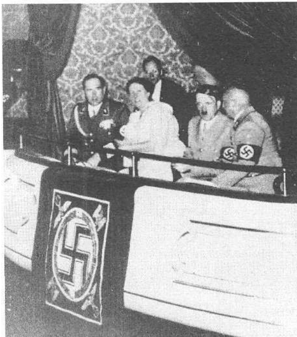
Adolf Hitler mit Winifred Wagner bei der Erstaufführung der «Meistersinger» zum Reichsparteitag 1935 im Nürnberger Opernhaus

H einrich Sutermeister, un «neutre» dans l'Etat nazi