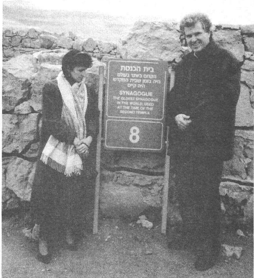
Der Autor und seine Frau vor der Synagoge in Massada

Die vermeintliche Gralsidylle erwies sich nach einigen Jahren – um genau zu sein: ich stand im 9. Lebensjahr – als ein mit allen Freuden und Ängsten durchlebter kindlicher Traum, der von der Wirklichkeit abrupt eingeholt wurde. Ich sah, ohne von der Schule oder zu Hause in entsprechender Weise vorbereitet worden zu sein, auf Anordnung des Bayerischen Kultusministeriums einen Dokumentarfilm über die Ereignisse von 1933 bis 1945 in Deutschland. Besonders die Bilder von den Lagern beängstigten mich sehr. Unverständlich blieben mir auch Ausschnitte aus den deutschen Wochenschauen dieser Zeit, in denen die Musik von Wagner und Liszt zur Propaganda der Nazi-Todesmaschinerie verwendet wurden. Ich kann heute sagen, dass dieser Dokumentarfilm der Beginn einer inneren Wende auch in meiner Auseinandersetzung mit Wagner wurde. Mit einem Schlag endete das Vertrauen gegenüber