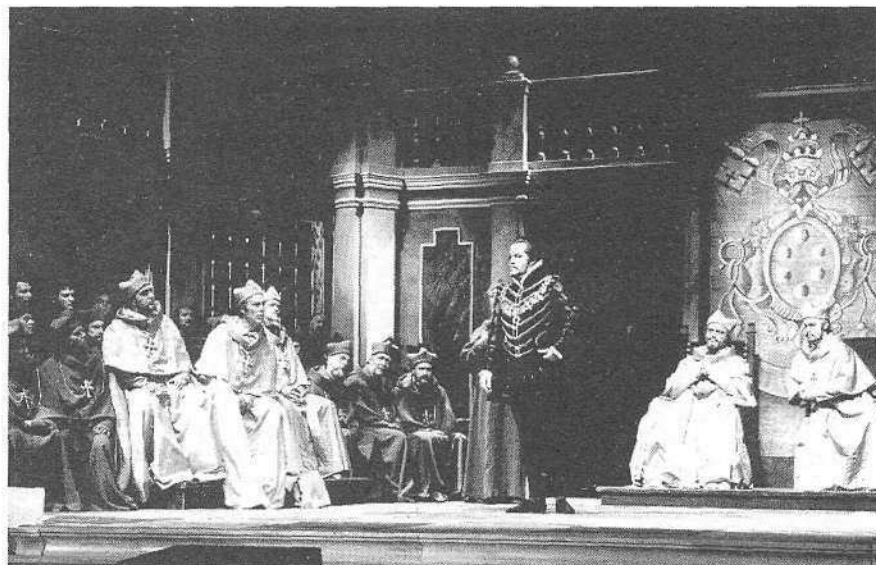
«Palestrina» à l'opéra de Zurich en 1968

la mort du Faust historique vers 1540 – quelque vingt-cinq ans plus tôt) et l'incorporation qui en résulte du plainchant, d'éléments Renaissance et néo-Renaissance dans les langages musicaux 9 . Il y a également des analogies de structure. Dans Palestrina , le long crescendo des chœurs d'anges pendant la composition de la messe est une réplique frappante de la grande progression du Credo choral qui accompagne la scène du pacte dans Docteur Faustus ; chez Busoni, la querelle entre étudiants protestants et catholiques de Wittenberg est une trouvaille qui vaut la bataille entre domestiques espagnols et italiens de Pfitzner. Le soliloque de Palestrina à l'acte 1, «Le dernier ami», qui débouche sur l'apparition des neuf maîtres appartient à la musique la plus élevée, tout comme le monologue de Faust, «Rêve de jeunesse», qui culmine dans l'apparition d'Hélène de Troie. Ces deux visions sont d'ailleurs les charnières de leurs drames respectifs. La comparaison musicale n'est pas possible, puisque Busoni n'eut pas le temps de composer la sienne, mais on verra Pfitzner tomber d'accord avec Busoni «qu'à un moment de lucidité particulière, un homme particulièrement doué pourrait percevoir un individu d'une «autre» époque, non