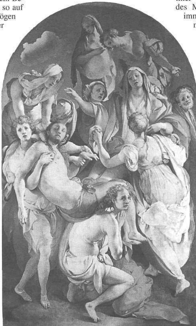
Bildbeispiel 1: Iacopo Pontormo, Grablegung

Auf seiner vermutlich im Jahr 1528 vollendeten «Grablegung» ( Bildbeispiel 1 ) gruppieren sich die Bestattungszuge um den toten Körper Christi wie ein seltsam schwebender Trauerchor. Balancieren dabei doch diejenigen unter ihnen, die den Leichnam tragen und auf deren Füßen immerhin die gesamte Komposition ruht, auf Zehenspitzen, sodass alles Tun jeglicher Schwerkraft enthoben scheint. Sogar der heilige Kadaver selbst ist des meisten Gewichts verlustig gegangen, so wie er da als eine Art übergrosse Laute gehalten werden kann. Die Malweise lässt die gleiche Strategie der Entkörperlichung erkennen. Die hauchdünne Lasur der Farben lässt an vielen Stellen noch die Unterzeichnung durchscheinen. Zudem bewirkt sie, dass das