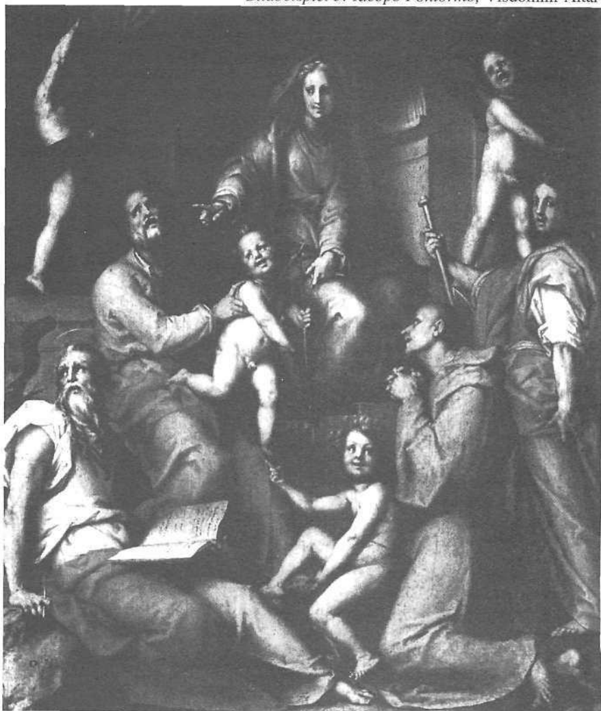
Bildbeispiel 5: Iacopo Pontorno, Visdomini-Altar

Die dadurch entstehende Sinnwidrigkeit löst sich erst zwanzig Takte später auf, wenn klar wird, dass nicht einmal die leichten Klänge der Pfeifen die tiefe Niedergeschlagenheit der Sänger zu beheben vermögen. Doch damit wird