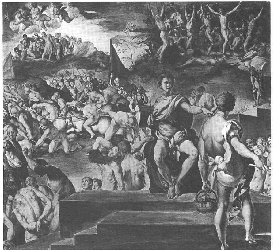
Bildbeispiel 2: Iacopo Pontormo, Das Martyrium der Elftausend

in einem Florenz, das immer autokratischer von der Bankiersfamilie der Medici regiert wurde, formierte sich im singfreudigen Bund der Oricellari die republikanische Opposition. Deren Verschworenheit schlug sich etwa in der von politischen Sympathien genährten Freundschaft zwischen Verdelot und Niccolò Machiavelli nieder. Als im Jahr 1525 ein Medici-Gegner aus dem Exil zurückkehrte, feierten die beiden den Anlass mit einer Komödie, genannt La Clizia , deren musikalische Zwischenspiele, im neuen madrigalesken Ton gehalten, wie ein griechischer Chor