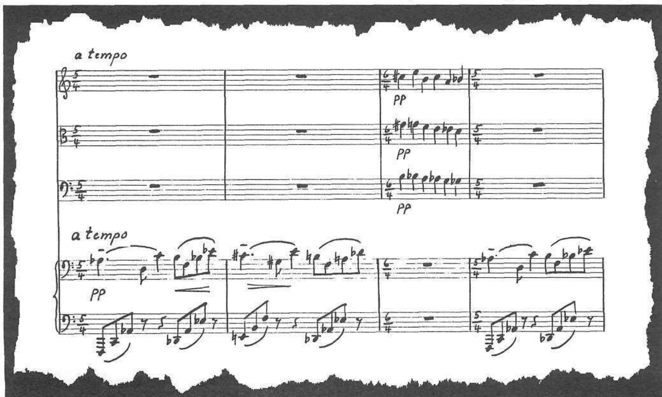
E) aus: Walter Lang «Quartett» (VI, Vla, Vc, Kl)